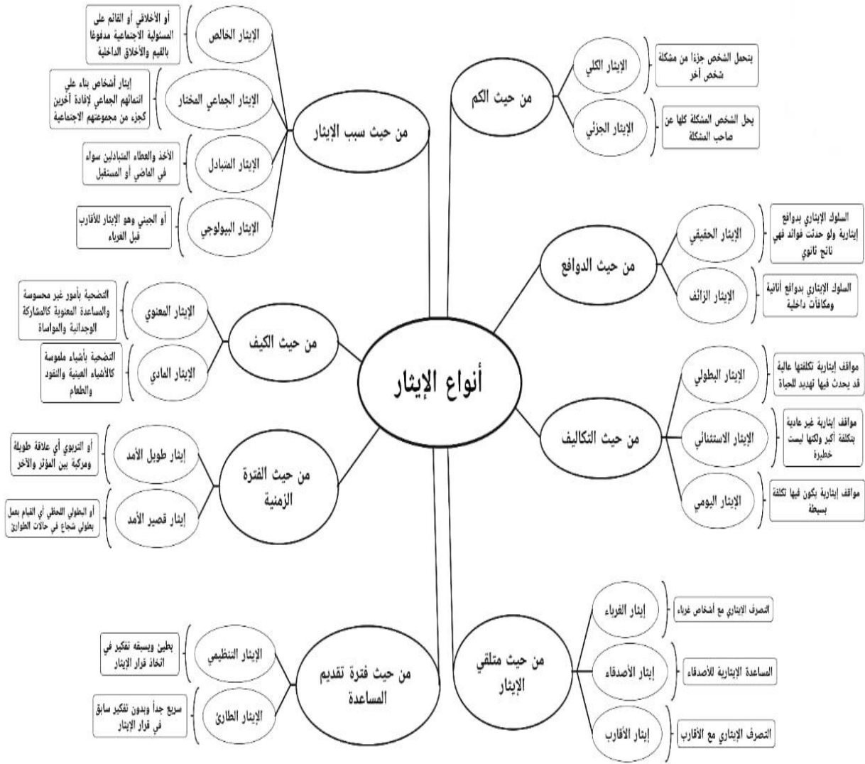
شكل (١) أنواع الإيثار